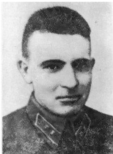
Н. И. Тихомиров