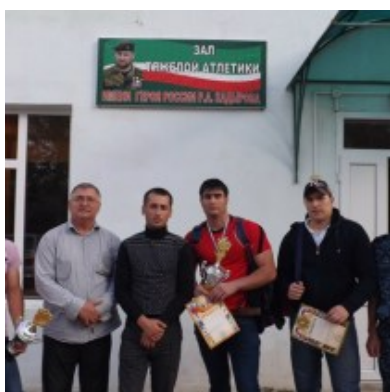
Победители и призеры были награждены грамотами, медалями