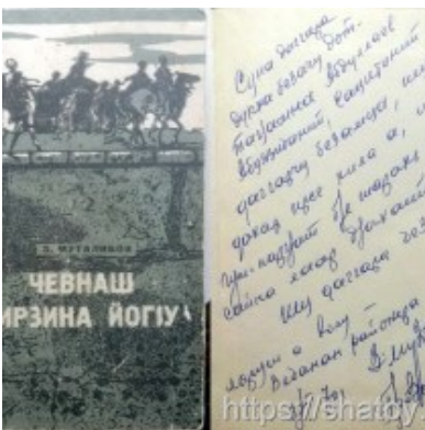
Подарок от известного чеченского писателя Зайнди Муталибова.