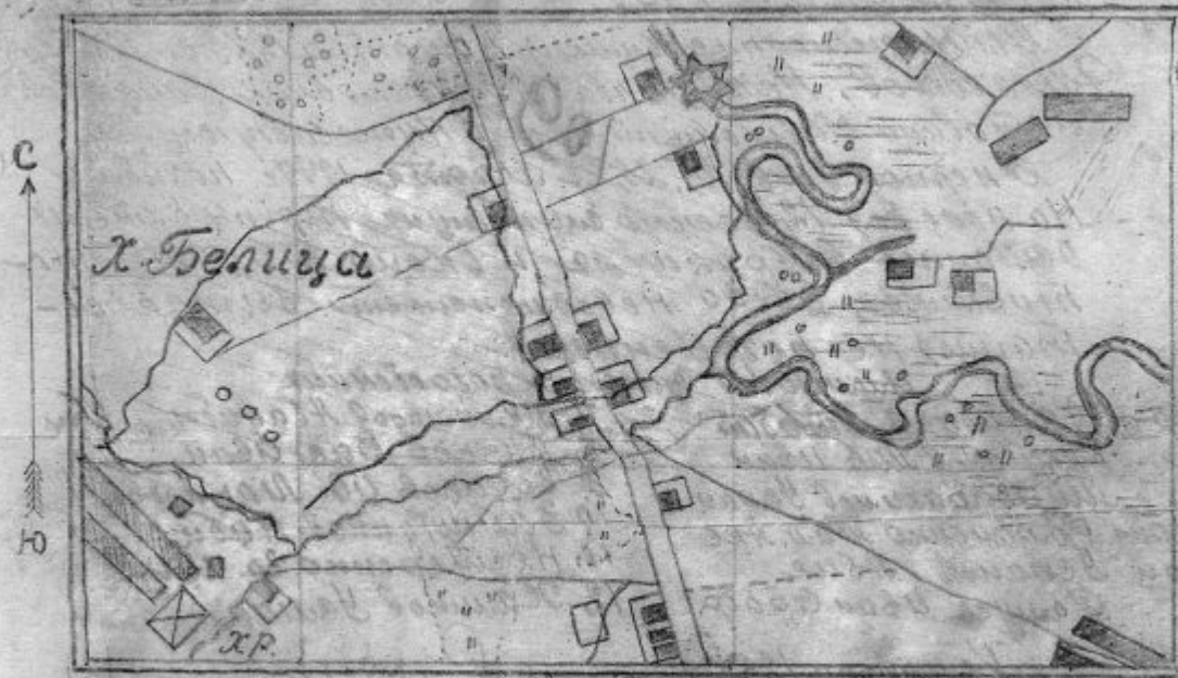
Схема района боевых действий 1225 сп. 25-26-27.4.49