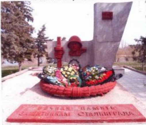
8. Фотоснимок захоронения