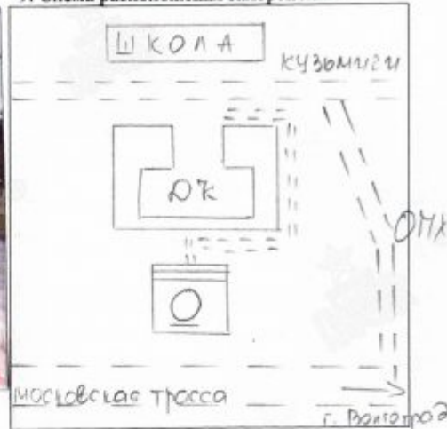
9. Схема расположения захоронения